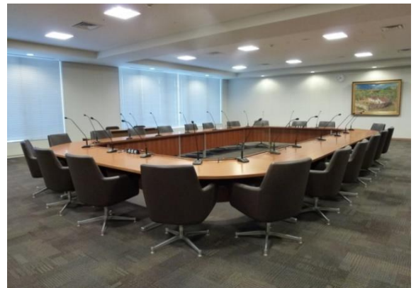
裁判官訴追委員会会議室

1日当たりコスト: 34.3万円(34.7万円) (参考)単位:年間日数 365日(365日)