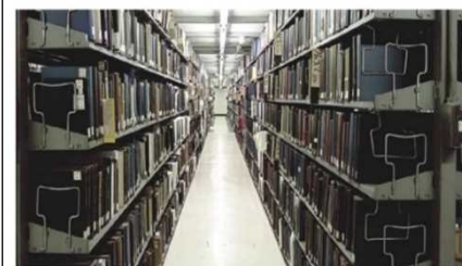
東京本館 本館書庫