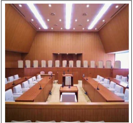
裁判官弾劾裁判所法廷