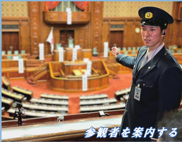
参観者を案内する