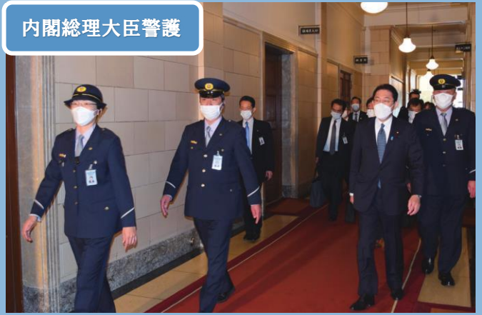
内閣総理大臣警護