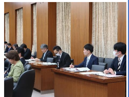
委員会での様子(右から2番目)

昨今は社会の変化が著しく、法を議論する場でも盛んにデジタル・IT関連のワードが登場し、対極に見えていた両者の結びつきが一層強くなっていると感じます。その議論を支えるため、両者を備えたバランス感覚は今後もあらゆる場面で求められるでしょうし、当局のデジタル人材に期待される役割も大きくなっていくはずです。