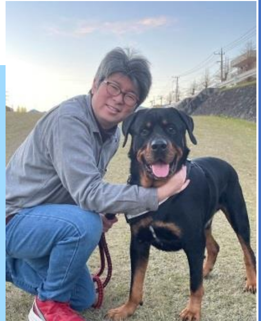
子犬すら怖くて抱けなかったのに、とある事情で大型犬を引き取ることに。今ではかわいくて仕方ありません。これも1つの「アップデート」ですね。

早くも紙幅が尽きてきてしまいましたが、いかがでしょうか？国会で働く自身の姿がイメージできましたでしょうか？拙文ではありますが、若く才能のあるみなさんが、国会をデジタルの側面から支えることに興味を持っていただけたら幸いです。