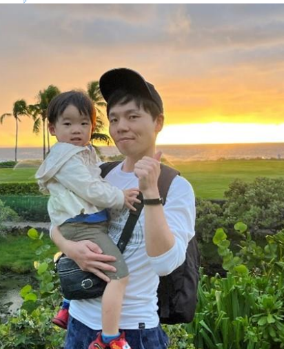
プレーヤーとしての野球と自重トレーニングが趣味。学生時代の専攻はデジタル系ではなく化学系。2児の父。

もちろん技術的な知識も必要となります。例えば、「インターネット上の誹謗中傷の投稿者を特定する手続きの流れについて説明してほしい」といった依頼を議員や秘書から受けることがあります。その際は、関連法令だけでなく、インターネットの仕組みも押さえておかなければなりません。私の場合、内閣サイバーセキュリティセンター(NISC)への出向によって情報通信技術への理解が深まり、この経験が今の業務にも活かしています。そうした背景知識や経験をも