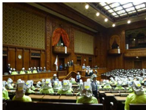
令和元年の防災訓練の様子