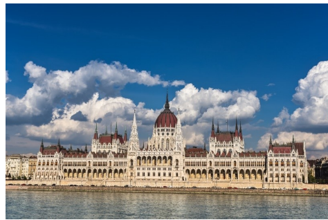
ドナウ河から見た国会議事堂

現在のハンガリーは、議院内閣制を採る共和国で、立法府は一院制となっており、国家元首は大統領で、政府の首班は首相です。議事堂の中には議会だけではなく、大統領や首相の執務室もあり、また、ハンガリー王が約900年間代々受け継ぎ、王国を象徴する聖王冠と宝珠や宝剣、王笏などの戴冠式用の品がこの議事堂内で保管展示されています。