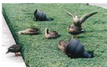
巣立ち数日前のカルガモの雛 ひな