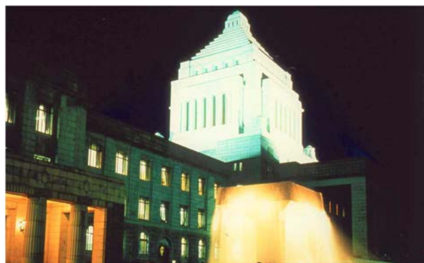
ライトアップされた国会議事堂の塔屋と噴泉

また、噴泉は、皇居から国会周辺にかけての緑豊かな環境の一部をなしています。平成7(1995)年5月下旬、噴泉周囲の植え込みで孵化したカルガモの雛 ひな 7羽と親鳥1羽が、噴泉に移り住み、広く報道されるなど注目を集めました。7月下旬に雛 ひな が巣立ち皇居方面に飛び去るまでの約2か月間、衆議院事務局は、噴泉の運転を停止し、周囲に金網を張り、屋根付きの餌台を設置して餌を与えるなどして温かく見守りました。