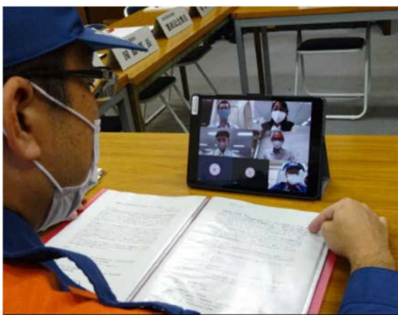
令和2年のリモート会議訓練の様子

しかし、令和2年は新型コロナウイルス感染症が猛威を振るっていることから、訓練の参加者が密になる状況を回避する必要がありました。このため、同年の総合防災訓練は、院内の各建物内での訓練を中心に実施して、多数の者が集まる大規模な訓練を取りやめるとともに、参観者ホールでは防災資機材の展示を行いました。また、同年からの新しい試みとして、タブレット端末を利用して各建物間のリモート会議訓練を実施しました。