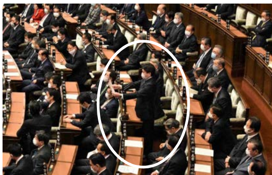
中央で起立しているのが議事進行係

独特の口調については、なぜそうしているのか、正確なところは不明のようです。ただし、マイクがなかった帝国議会時代に「独特な抑揚で大きな声で議場いっぱい響きわたるように工夫された議事進行の発声」と説明している文献があります。