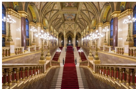
国会議事堂正面の大階段