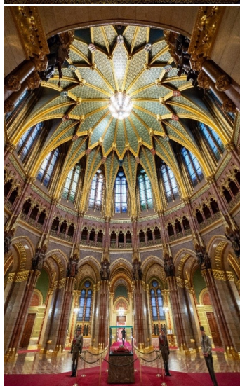
ドームホールの中央に展示されている聖王冠と衛兵

1885年に着工され、1902年に完成した議事堂は、コンペティションで設計を決定し、折衷主義を基本として、ゴシック様式、ルネッサンス様式、バロック様式が溶け合い、691の部屋が連なる長さ268m、奥行き123m、高さ96m、総面積約1万8,000㎡のハンガリー最大の建築物で、装飾には40kgの黄金が使用されました。建設当時の国会は二院制であり、議場の大きさ・形は同一で、両院の平等を表しており、その間にあるドームは、2つの議会の共同開会のための会場となり、議会の統一を意味しています。