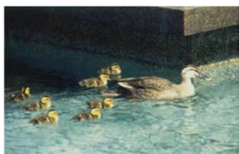
発見された当日のカルガモの親子

また、噴泉は、皇居から国会周辺にかけての緑豊かな環境の一部をなしています。平成7(1995)年5月下旬、噴泉周囲の植え込みで孵化したカルガモの雛 ひな 7羽と親鳥1羽が、噴泉に移り住み、広く報道されるなど注目を集めました。7月下旬に雛 ひな が巣立ち皇居方面に飛び去るまでの約2か月間、衆議院事務局は、噴泉の運転を停止し、周囲に金網を張り、屋根付きの餌台を設置して餌を与えるなどして温かく見守りました。