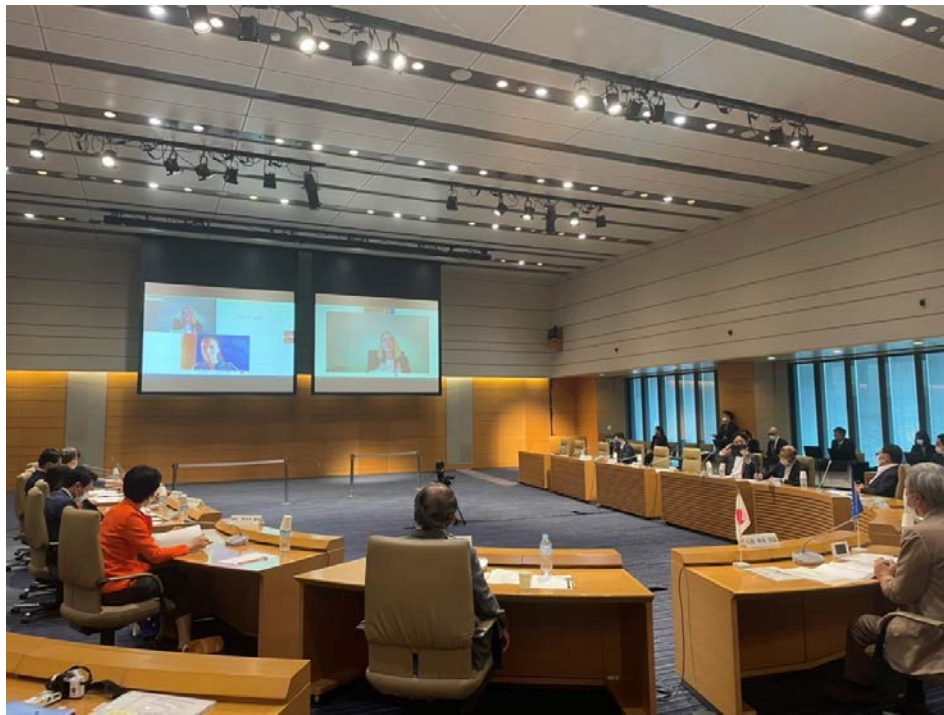
日本・EU議員会議特別会合

(注3) 昭和53(1978)年から原則として年1回日欧交互に、日本国会(衆参両院)と欧州議会との間で公式に交流を行っている。なお、令和3(2021)年の会議は、オンライン形式により特別会合として開催された(衆議院のみ参加)。