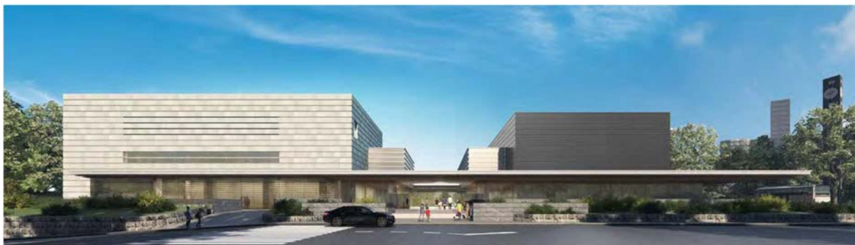
新国立公文書館（左）及び新憲政記念館（右）西側外観部分

憲政記念館代替施設は、会議室や展示、収蔵といった主要な機能を維持することとして、国会参観バス駐車場の北側にある国有地に建設された総建物面積約3,200㎡、地上3階の建物で、令和4年6月に開館しました。