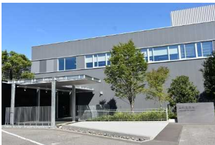
憲政記念館（代替施設）

令和4年、憲政記念館は、開館50年を迎えたことを記念して憲政記念館概要及び主な収蔵資料を取りまとめた「憲政記念館50年のあゆみ」を発行しました。