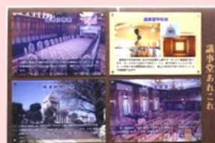
議事堂あれこれ（国会豆知識）