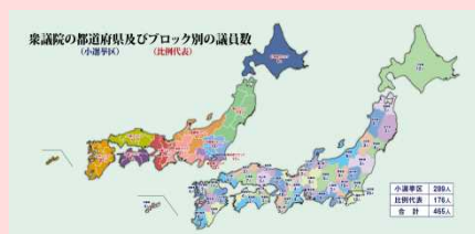
衆議院の都道府県及びブロック別の議員数