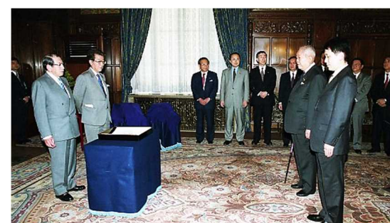
平成15年1月29日 小柴昌俊氏（物理学）、田中耕一氏（化学）