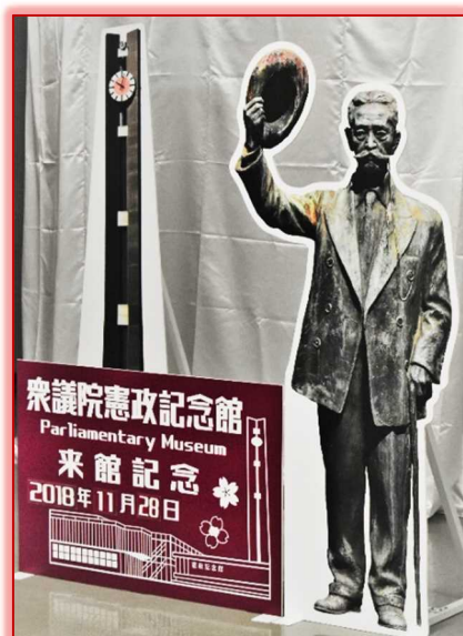
写真撮影用パネル

当館では、シリーズ特別企画展示の一環として、来館記念の写真撮影用パネルを製作し、11月より1階受付脇に設置いたしました。