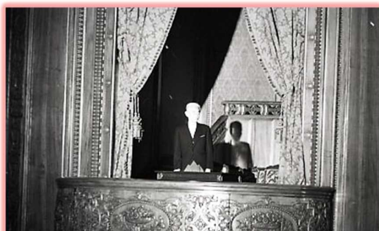
昭和44年1月27日 川端康成氏（文学）