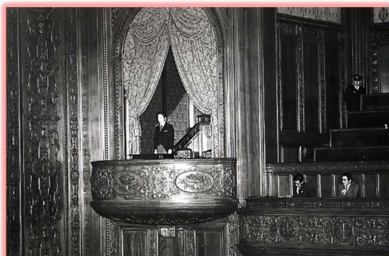
昭和49年3月29日 江崎玲於奈氏（物理学）