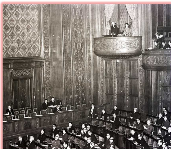
昭和40年12月25日 朝永振一郎氏（物理学）

1965年に国会を訪問した朝永振一郎氏から1982年に国会を訪問した福井謙一氏までは衆議院議場の貴賓席で紹介されています。