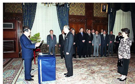
平成14年1月22日 野依良治氏（化学）