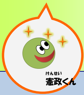
けんせい 憲政くん

とくべつ きかく てんじ ばくまつ めいじ げきどう ★特別企画展示「幕末明治からのメッセージ 激動の