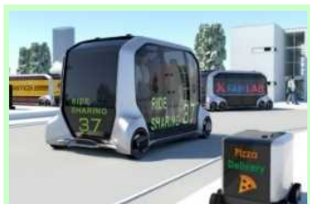
オフィスや診療所等多目的に活用できるモビリティサービス専用次世代電気自動車「e-Palette(イーパレット)」(トヨタ自動車)