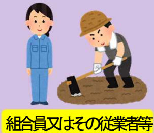
組合員又はその従業者等

地域人口の急減：一定の地域において地域社会の維持が著しく困難となるおそれが生じる程度にまで人口が急激に減少した状況