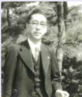
いりえ 俊郎 としお 入江 俊郎 (明治34年1月10日～昭和47年7月18日) 東京都出身。内務省入省後、昭和2年法制局(現内閣法制局)参事官、昭和21年同長官。この間、日本国憲法の制定等の立案責任者として尽力。昭和21年、貴族院議員に勅選。昭和23年以降、国立国会図書館専門調査員、衆議院法制局長、最高裁判事などを歴任。

その後、昭和23年7月に発足した衆議院法制局の初代法制局長に就任し、戦後法制の形成期における議員の立法活動を支えました。占領下のこの時期、法案の国会提出に当たり必要とされていたGHQのクリアランス(承認)に関し、議員立法については法制局長において憲法適合性を保証する