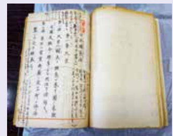
▲入江の遺した「憲法改正草案要綱」(昭和21年3月6日発表)

行政、立法、司法にわたる三権の各分野において、憲法の価値を守り通した生涯でした。