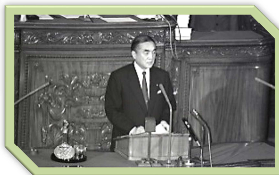
← 鈴木善幸内閣総理大臣 昭和 57 年 6 月 21 日 衆議院本会議