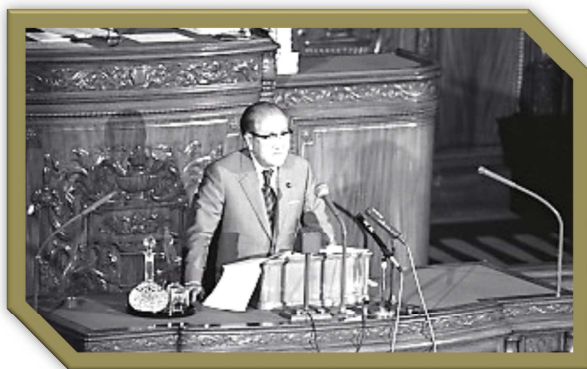
→ 中曽根康弘内閣総理大臣 昭和 59 年 4 月 13 日 衆議院本会議