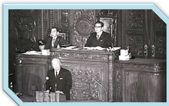
↑ 大平正芳内閣総理大臣 昭和 55 年 2 月 12 日 衆議院本会議

当館に所蔵されている写真フィルムのうち、第 91 回国会（1980 年（昭和 55））から第 101 回国会（1984 年（昭和 59））の写真の一部をパネルにして展示しています。当時の大平正芳総理や鈴木善幸総理、中曽根康弘総理等の写真で昭和 50 年代後半の国会を振り返ります。