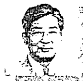
仙谷 由人 前衆議院議員