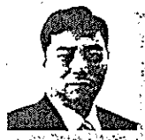
五島 正規 衆議院議員