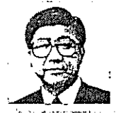
横路 孝弘 前北海道知事