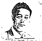
海江田 万里 衆議院議員