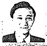
鳩山 由紀夫 衆議院議員