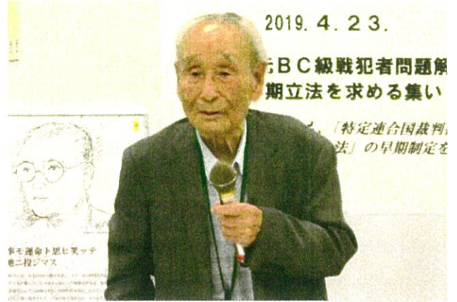
2019. 4. 23. 衆議院議員会館で