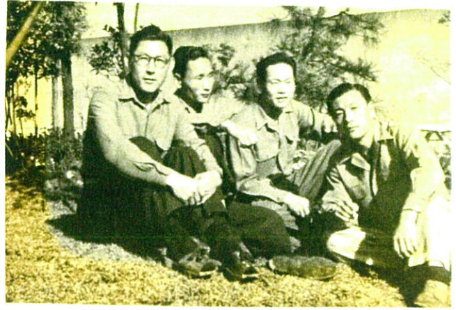
1952年スガモ・プリズンで仲間と(左から2番目)