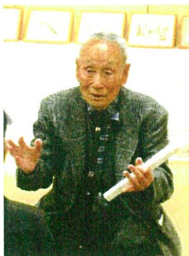
2016 年 10 月九段ギャラリーで