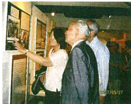
2007年在日韓人歴史資料館で