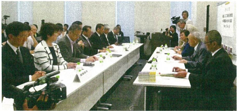
2016年超党派国会議員との懇談会(衆議院議員会館)