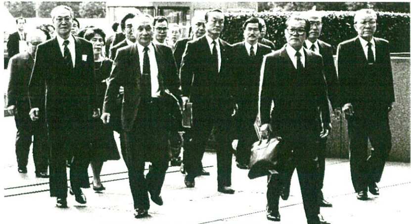
1991年国家補償を求めて東京地裁に提訴