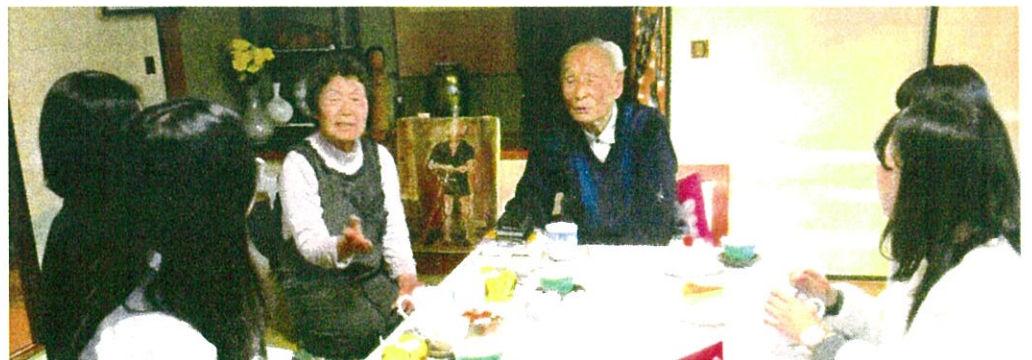
2017 年 11 月自宅で大学生と懇談