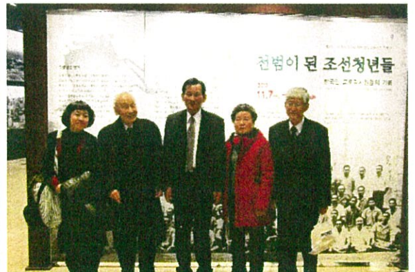
2013年ソウル市歴史博物館で韓国・同進会役員らと