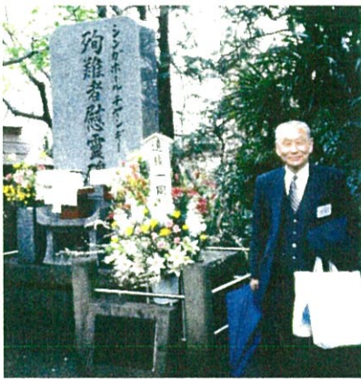
池上・照栄院のシンガポール刑死者慰霊碑前で