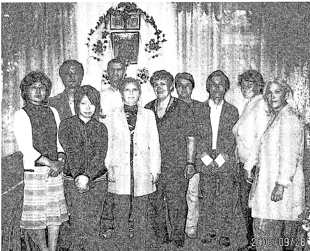
ゼムリヤキ訪問の記念撮影

当団体の活動はボランティア的なものであり、寄附金によってのみ存続しています。ウクライナが経済的に厳しい状況にある今、私たちは財政上の困難に苦しんでいます。公の機関からのサポートを得られないまま、私たちは、世界の人々に支援を求めざるを得ません。専従スタッフはわずか2名で、その2名もわずかな給与を得ているだけです。他の20名のスタッフはボランティアで、そのことも活動の質に影響します。