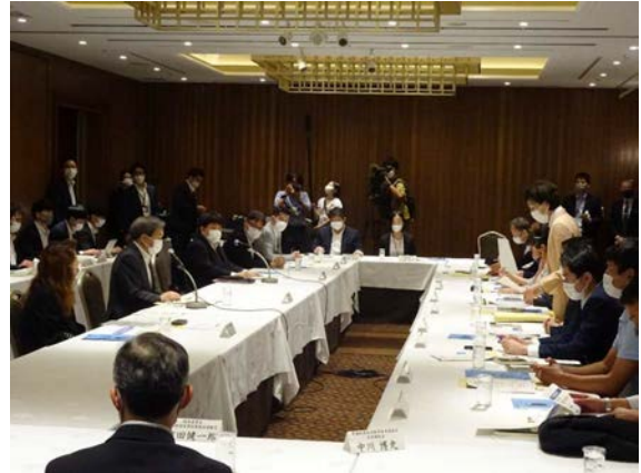
熊本県知事との意見交換（熊本県熊本市）