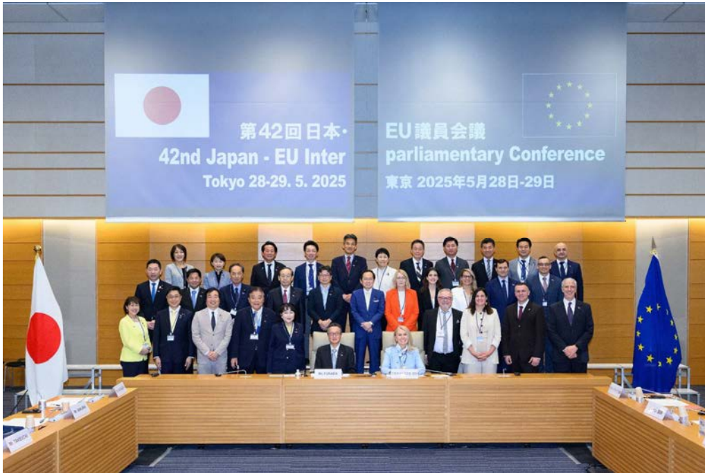
第42回日本・EU議員会議