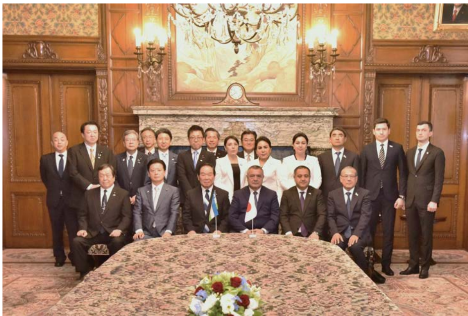
ウズベキスタン共和国最高議会議長一行