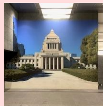
国会議事堂参観記念撮影スポット