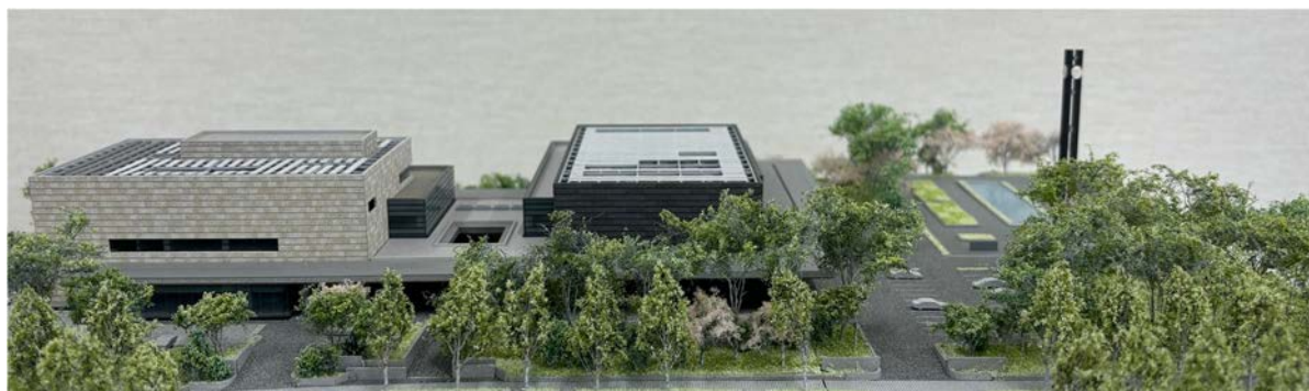
新憲政記念館（中央）と新国立公文書館（左）完成予想模型

憲政記念館代替施設は、新館が開館するまでの間、会議室や展示、収蔵といった主要な機能を維持することとして、国会参観バス駐車場の北側にある国有地に建設された総建物面積約3,200㎡、地上3階の建物で、令和4年6月に開館しました。