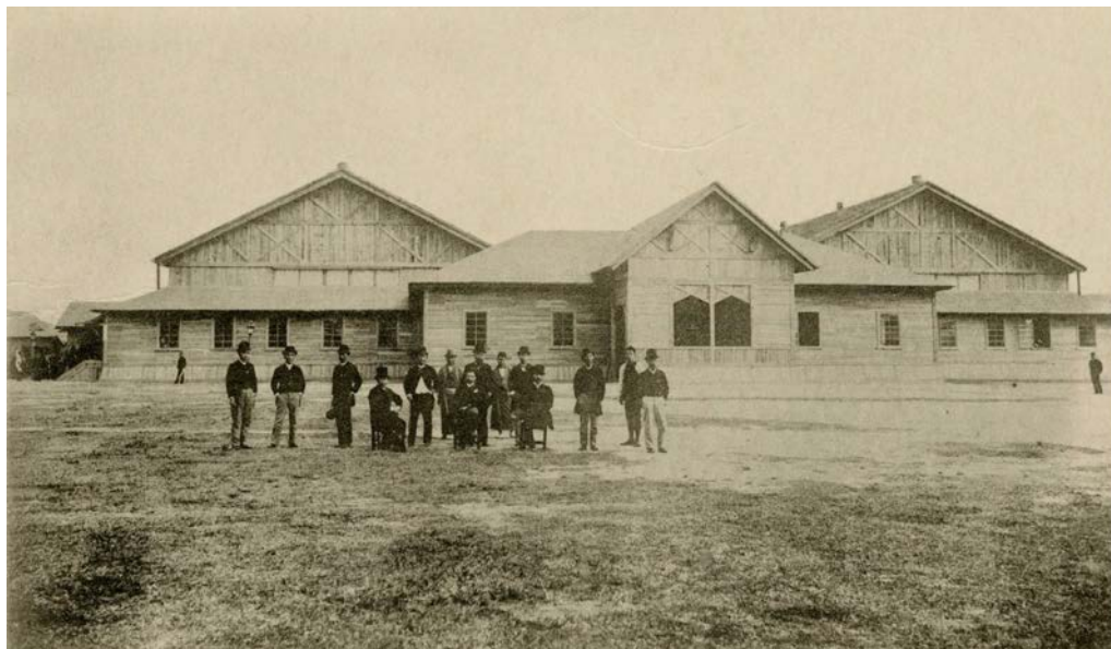
日清戦争時の広島臨時仮議事堂(広島市公文書館所蔵)

仮議事堂の建物が帝国議会の議場として使われたのはこの一度だけであり、陸軍の病院や兵舎などとして利用された後、建設から4年後の明治31(1898)年に解体されています。現在、かつて仮議事堂のあった場所(広島市中区基町)には、「臨時帝国議会仮議事堂跡」の碑が建っています。