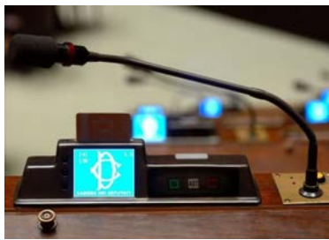
議員席のマイクと投票ボタン (下院)