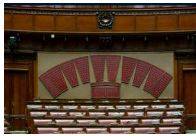
スコアボードに各議員の投票状況が色分けして表示される (下院)

参考：イタリア議会HP、駐日ローマ教皇庁大使館HP、地球の歩き方編集室『地球の歩き方 ローマ 2025～2026年版』(株式会社地球の歩き方、2024年)、竹中治堅監修『議会用語事典』(学陽書房、2009年)、白井仁編集『世界旅行百科 ヨーロッパ編』((株)ザ・トラベル商会、昭和54年)