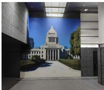
国会議事堂参観記念撮影スポット

「衆議院ビジターセンター」では、参観の前後を通して来訪される皆さんに有意義な時間をお過ごしいただくため、多様な情報の発信などに努めております。今後もビジターの視点に立った改善を進めていくとともに、将来的には、憲政記念館と密接に連携した取組の実施を構想しています。参観にお越しの際には、ほんのひととき、こちらでの時間をお楽しみください。