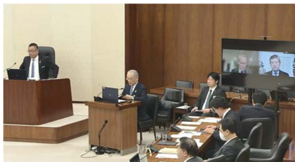
安全保障委員会（オンラインでの参考人）

国会へのオンライン出席は一足飛びには進みませんが、確かな変化が生まれています。社会の変化に合わせ、国会がより開かれ、機動的に議論ができる場へと発展していくことが期待されます。