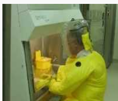
安全キャビネット内での ウイルスを用いた作業

「感染症研究国際展開戦略プログラム」では、9大学が海外研究拠点で、各地で流行したウイルスの遺伝子解析を行うなどの基礎研究を行っている。新型コロナウイルス感染症についても、検体の収集・分析、迅速診断技術の確立等、予防・診断・治療法の研究開発が行われている。