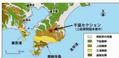
千葉セクションの位置

千葉県市原市の養老川河岸に露出する地層断面「千葉セクション」が、地球上の磁場逆転を最も分かりやすく示していたことなどから、中期更新世（77.4万年前～12.9万年前）の地質時代の名称として「チバニアン」と命名された。