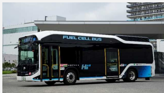
水素社会の構築に向けた環境・エネルギー技術

また、政府の取組として未来社会のビジョンを設定し、それに向かって研究開発を行うプログラムであるムーンショット型研究開発制度や、ビジョン主導型のチャレンジ・ハイリスクな研究開発を支援するプログラムであるセンター・オブ・イノベーションプログラム、来館者と研究者が未来の社会像について共に考える活動を推進している日本科学未来館の取組、未来社会の実験場として期待される2025年日本国際博覧会（大阪・関西万博）、IoT、ビッグデータ等の先進的技術の活用により都市・地域の課題の解決を図るスマートシティの取組を紹介している。さらに、東京2020大会も契機に研究開発を進めてきた科学技術による課題解決に向けた具体的な研究開発の取組として、水素社会の構築に向けた環境・エネルギー技術等を紹介している。