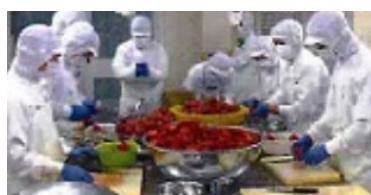
地元の野菜や果実からジュースやジャムを製造し、販売