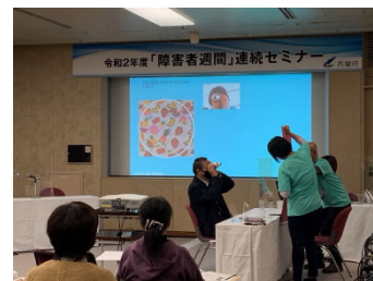
「障害者週間」連続セミナー