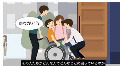
「心のバリアフリー」を学ぶアニメーション教材