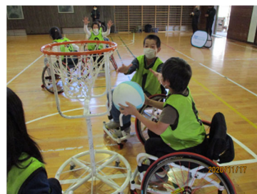
長野県民障害者スポーツプロジェクト