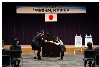
「障害者週間」関係表彰式