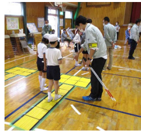
視覚障害者疑似体験(バリアフリー教室)