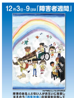
障害者週間ポスター