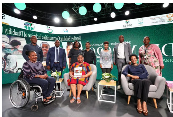
ガイドライン披露式典

「JICA(独立行政法人国際協力機構)」の技術協力プロジェクトにより、南アフリカ共和国社会開発省が障害者に対する福祉サービスを地方行政レベルで実施するための指針(ガイドライン)を作成、2020 年 12 月に公表