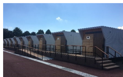
トレーラーハウスを活用した車いす対応型の合宿所(田川市)