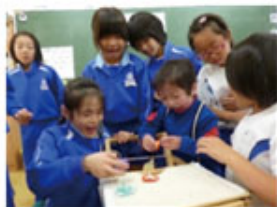
音楽の授業や給食を通じた居住地校での交流及び共同学習

教育委員会が主体となり、学校において、障害のある幼児児童生徒と障害のない幼児児童生徒等の交流及び共同学習の機会を設けることにより、障害者理解の一層の推進を図る取組等を実施。また、「ユニバーサルデザイン2020 行動計画」に基づき「心のバリアフリー学習推進会議」を設置、心のバリアフリーの促進を図るとともに、教育委員会や学校等に対して積極的な取組の促進