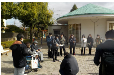
バリアフリー推進パートナーや当事者によるまち歩き点検(福島市)