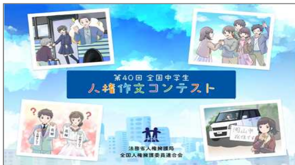
通算40回を記念した 特設サイト

上位入賞作文の朗読動画、高円宮妃殿下からのお言葉、過去の受賞者からのメッセージ等を掲載